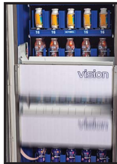
Ascensor de entrega de producto Elevador de entrega de produto