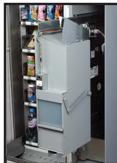
Estructura modular con elementos extraíbles Estrutura modular com elementos extraíveis