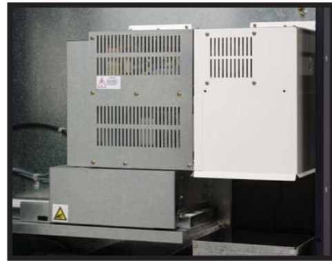
Modulo de microondas Módulo de microondas