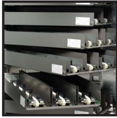
Bandejas de carga horizontal Tabuleiros de carregamento horizontal