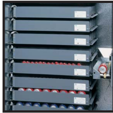
Ascensor de entrega de producto sin golpes Elevador de entrega de produto sem choques