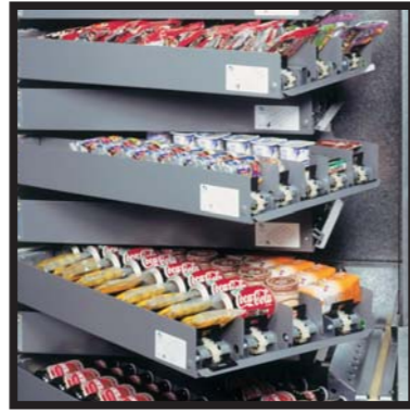
Bandejas de carga horizontal Tabuleiros de carregamento horizontal