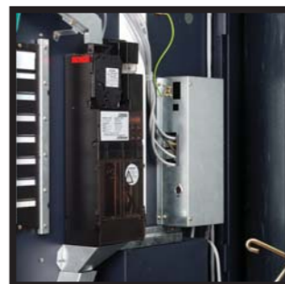
Monedero Jofemar J2000 de 5 tubos para devolución de 5 valores de moneda Porta-moedas Jofemar J2000 de 5 tubos para devolución de 5 valores de moneda