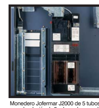
Monedero Jofemar J2000 de 5 tubos para devolución de 5 valores de moneda Porta-moedas Jofemar J2000 de 5 tubos para devolución de 5 valores de moneda