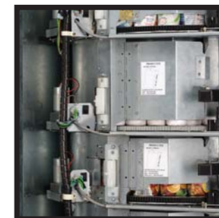
Tambores horizontales con espiral interna Tambores horizontais com espiral interna