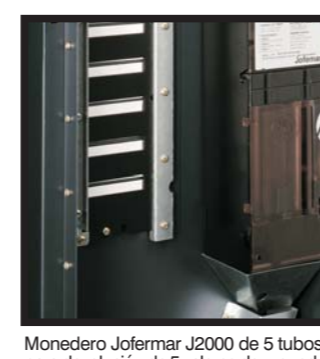
Monedero Jofemar J2000 de 5 tubos para devolución de 5 valores de moneda Porta-moedas Jofemar J2000 de 5 tubos para devolución de 5 valores de moneda