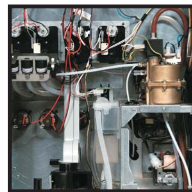
Acceso a componentes en la parte trasera Access to components by the machine back