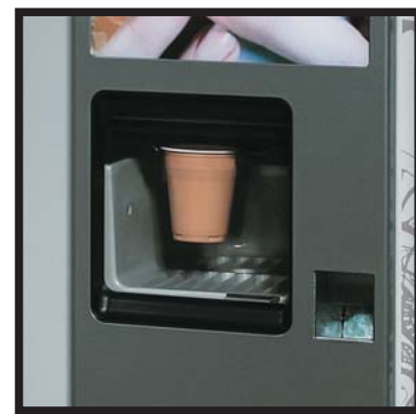
Ventana de recogida G250 Collection window G250