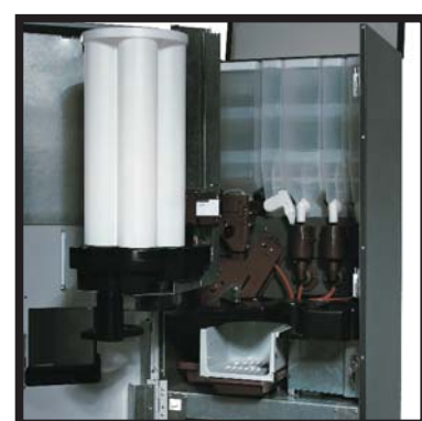
Capacidad para 250 servicios Capacity for 250 services