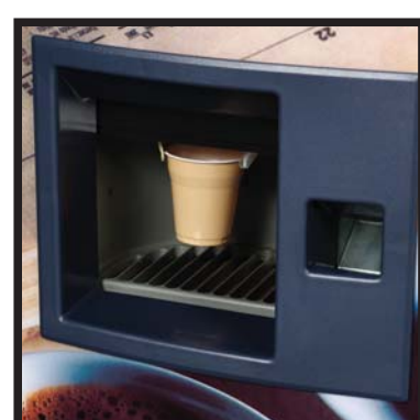
Ventana de recogida S500 Collection window S500