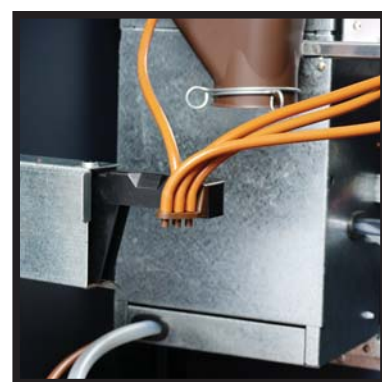
Brazo de dispensación retractil Retractable dispensing tap