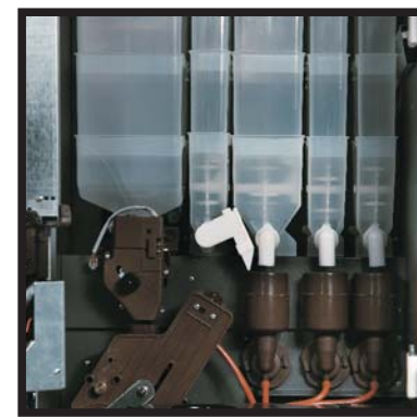
Detalle batidores y erogador G250 Wippers and brewer detail G250